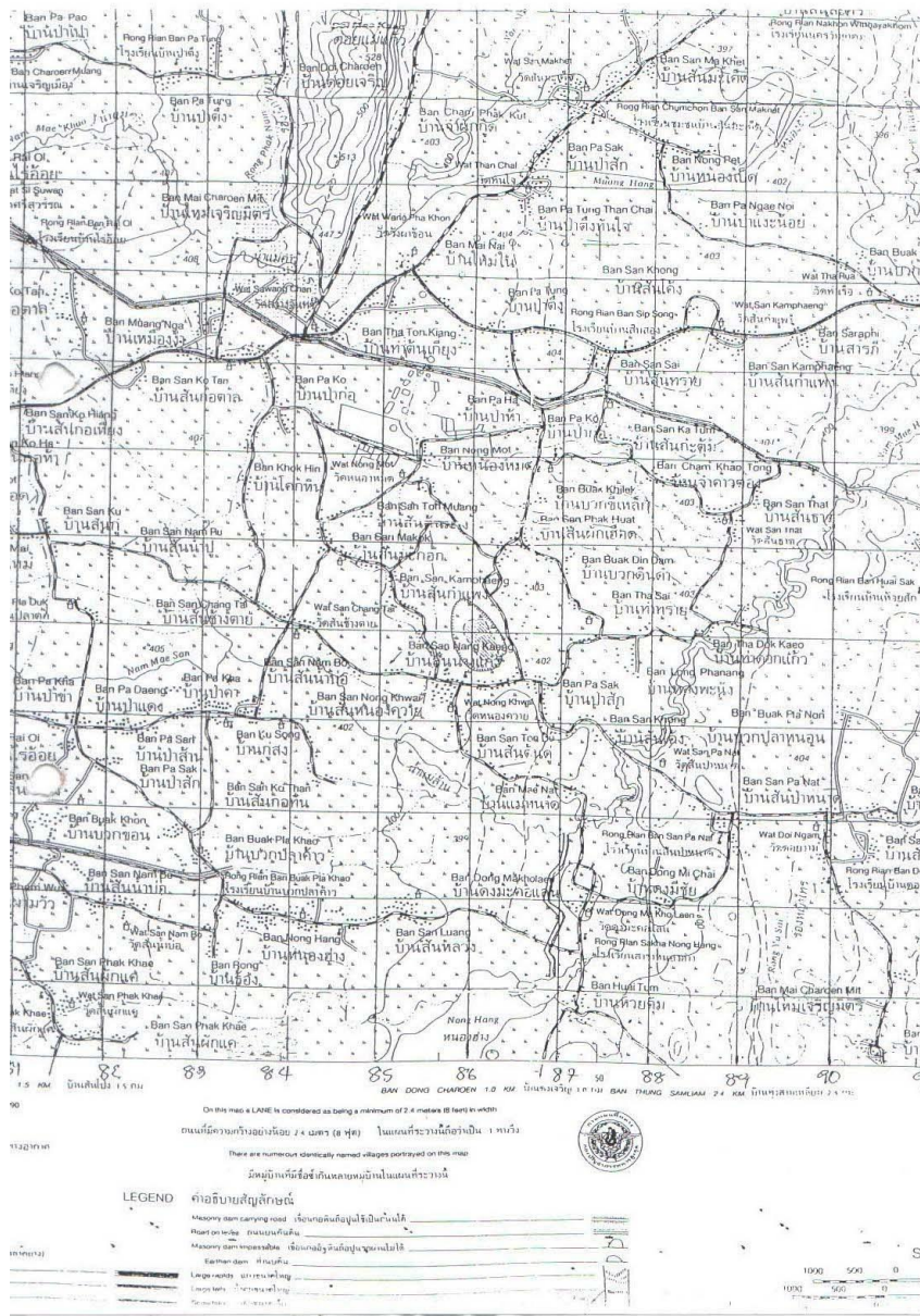
แผนที่ตำบลดอยงาม